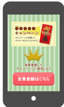
貴社サイトにて会員登録